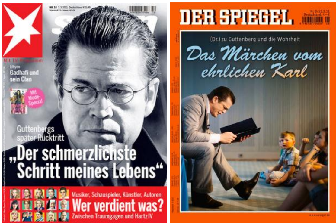
Abbildung 2 Plagiat: Dies muss vermieden werden 19

Wenn fremdes Gedankengut übernommen wird, ist dies im Text durch ein Fußnotenzeichen zu kennzeichnen. Als Fußnotenzeichen sind hochgestellte arabische Ziffern zu verwenden, die nicht in Klammern gesetzt werden. Die erste Fußnote im Text erhält die Ziffer 1, die weiteren Fußnoten werden fortlaufend beziffert. Ist der Inhalt eines vollständigen Satzes aus einer Quelle übernommen, so ist die Fußnotenziffer hinter das den Satz abschließende Satzzeichen zu setzen.